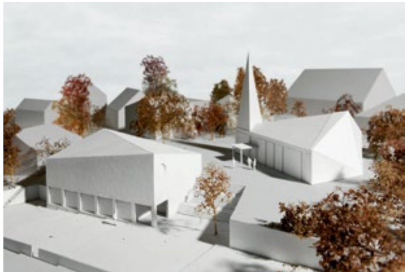
Der Siegerentwurf «Thales» stellt der Kirche mit ihrem expressiven Trapezgrundriss ein präzise gesetztes Volumen gegenüber, das zwischen Fauggersweg und Kirchplatz vermittelt und das zurückgesetzte Grundstück gleichzeitig zum Strassenraum öffnet.

Nicht nur das Interesse, auch die Herausforderungen bei diesem offenen Wettbewerb waren gross. Es galt, einen Ersatzbau schlicht und stimmungsvoll in die bestehende Anlage einzupassen und gleichzeitig einen starken räumlichen Bezug zwischen Kirche, Pfarreigebäude und Aussenraum zu schaffen. Die